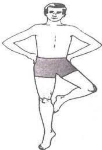
تصویر ۱ نمونه اجرای تمرین لک لک