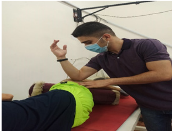
تصویر ۲: ماساژ ایسکمیک ناحیه

تراول ۱ و سیمونز این درمان را «فشرده‌سازی ایسکمیک» نامیدند، زیرا با آزاد شدن فشار، ابتدا پوست سفید می‌شود و سپس پرخونی و اکنشی نشان می‌دهد. این تغییرات مربوط به تغییرات گردش خون در عضله زیرین است که تحت فشار یکسان قرار می‌گیرد. فشار را می‌توان با انگشت شست، انگشت، بند انگشت یا آرنج بسته به اندازه، عمق و ضخامت عضله تحت فشار اعمال کرد. فشار خاصی به‌طور مستقیم به مرکز نقطه ماشه تا تحمل بیمار اعمال می‌شود. باید مراقب بود که از حد تحمل بیمار فراتر نرود و در صورت تنش یا کنار کشیدن بیمار باید فشار کمتری اعمال شود. اگر فشار بیش از حد دردناک باشد، بیمار با سفت شدن عضله در ناحیه پاسخ می‌دهد. اعمال فشار به مرکز نقطه ماشه‌ای بسیار مهم است. این نیاز به مهارت لمس قابل توجهی دارد و مهم است که از مرکز نقطه ماشه خارج نشوید، زیرا باعث درد بیهوده می‌شود. فشار به مدت ۱۰ تا ۲۰ ثانیه حفظ می‌شود و با رها شدن نقطه ماشه به تدریج افزایش می‌یابد (۲۸).